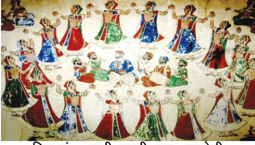
चित्र सं. 4 शाही सवारी, गढ़, धनकोली